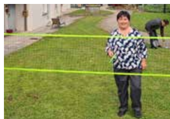
Une résidente profite des activités proposées au Foyer