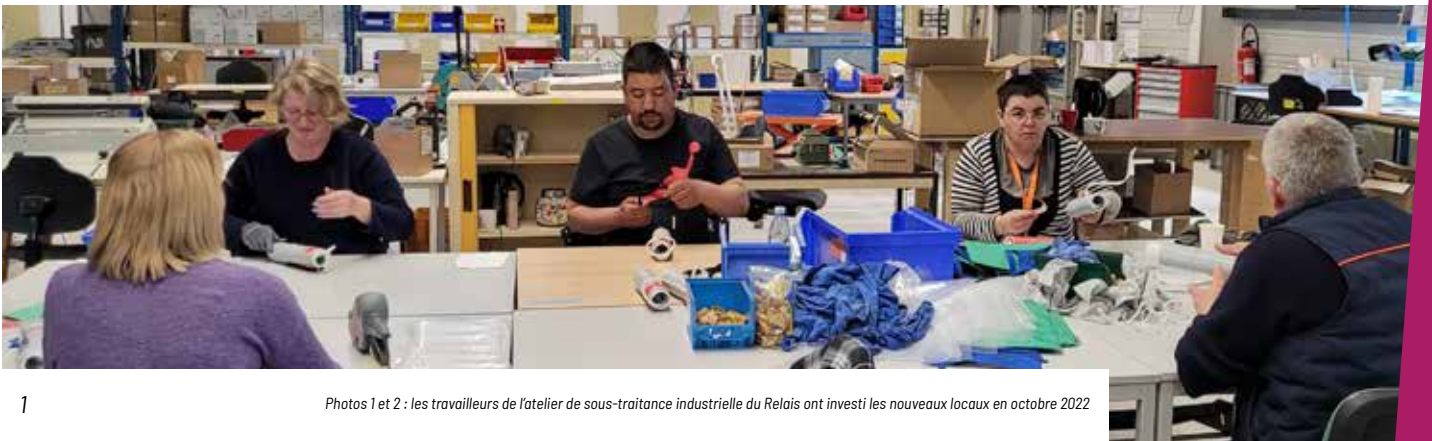
1 Photos 1 et 2 : les travailleurs de l'atelier de sous-traitance industrielle du Relais ont investi les nouveaux locaux en octobre 2022

Les témoignages ci-dessous de quelques usagers de l'ESAT permettent de mieux comprendre l'impact de ces changements sur leur environnement professionnel :